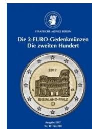
Die 2-Euro-Gedenkmünzen - Die zweiten Hundert