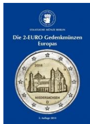
Die 2-EURO-Gedenkmünzen Europas - Band I - 3. Auflage 2014